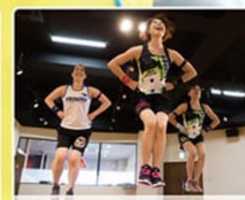
楽しく効果的なプログラム