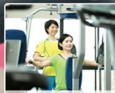
プロによる運動指導