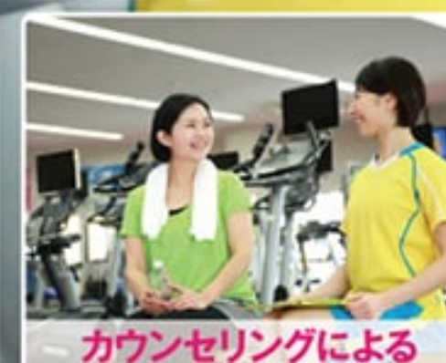
カウンセリングによる個人フォロー